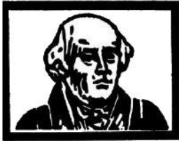
Dr. Samuel Hahnemann