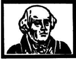
Dr. Samuel Hahnemann