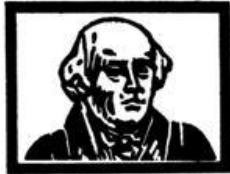
Dr. Samuel Hahnemann