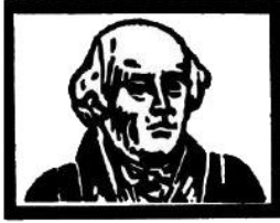
Dr. Samuel Hahnemann